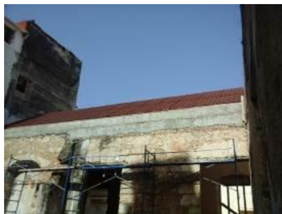
Colocación de impermeabilizante y bajo teja en techo a dos aguas de la parte delantera del inmueble.