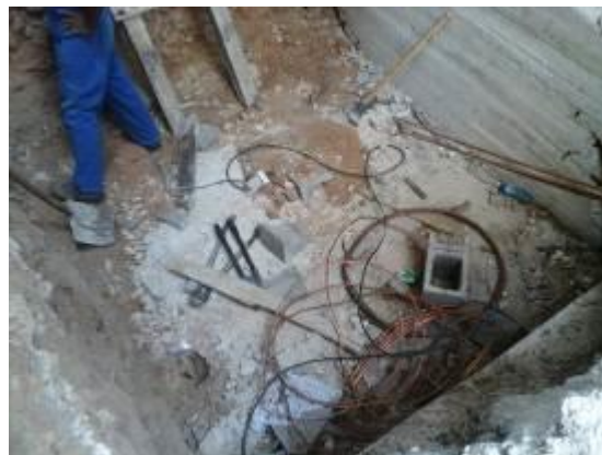
Realización del aterramiento del sistema eléctrico del inmueble