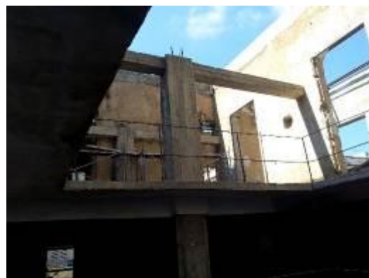
Encofrado parcial para hormigonar losa de entepiso, vigas y columnas para colocación de vigueta y bovedilla en el nivel +10.80m