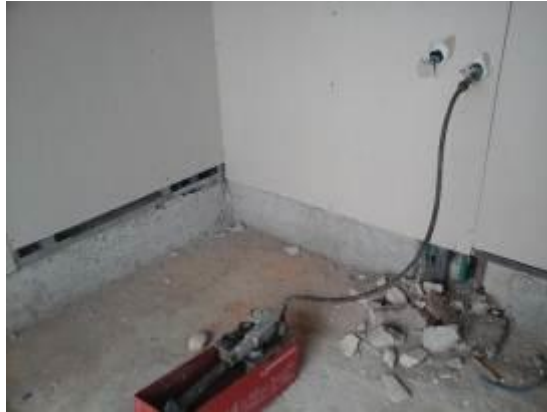
Instalaciones hidráulicas y sanitarias del nivel +4.85 m