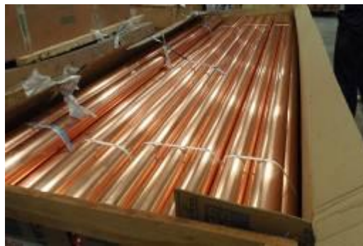
Apertura de los suministros de los canales, bajantes pluviales de cobre y sus accesorios